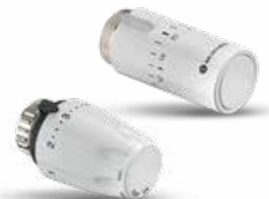
IMI Heimeier-serien av termostathoder

Vurder å skifte termostathodene for bedre ytelse.