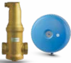
Zeparo luftutskillere & Statico