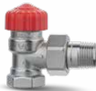
TRV 3 Calypso

Anlegget trenger hydraulisk innregulering, og en ventil med automatisk mengderegulering er den enkleste løsningen på dette problemet. Ikke behov for lange utregninger.