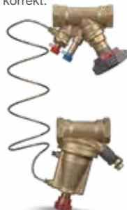
STAP STAD sett Differansetrykkregulator

Tilgjengelig trykk er relativt høyt i enkelte elementer i anlegget. Mengderegulering eller differansetrykkregulatorer må monteres eller er ikke satt opp korrekt.