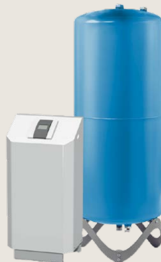
Transfero Connect systeem

Transfero Connect biedt drukbehoud prestaties van wereldklasse, vacuümontgassing en water bijvulling alles in 1 apparaat. Deze waardevolle optie bespaart ruimte en vereist slechts 2 elektrische aansluitingen.