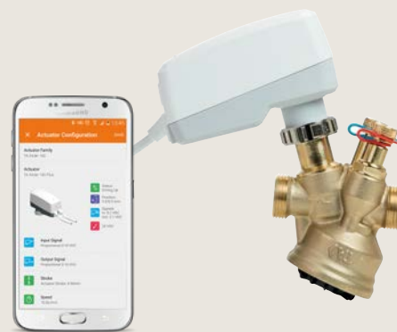
TA-Slider & HyTune app

Deze regel oplossing is volledig configureerbaar via een smartphone-app, zodat u geen dipswitches hoeft in te stellen met een schroevendraaier in donkere plafonds. Het bevat meer dan 200 instellingen voor volledige aanpassing op locatie. De «knippen & plakken» functie maakt het mogelijk de motorconfiguraties te kopiëren in slechts één klik.