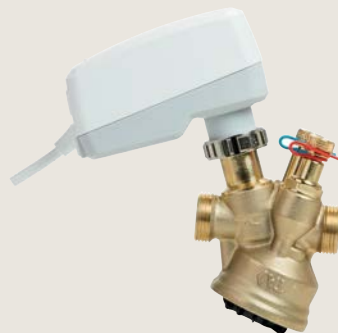
TA-Slider & TA-Modulator motor en afsluitercombinatie

efficiënter in het opvangen van zelfs de kleinste vuildeeltjes