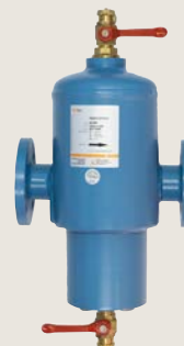
Zeparo G-Force vuilafscheider