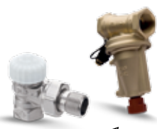
V exact II & STAP

La pression disponible est relativement élevée sur certains éléments du système en raison de la taille de l'installation. Des régulateurs de débit ou des régulateurs de pression différentielle doivent être installés. S'ils existent, vérifiez qu'ils soient configurés correctement