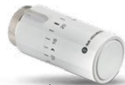
IMI Heimeier gamme de têtes thermostatiques

Veuillez envisager de remplacer les têtes thermostatiques pour de meilleures performances