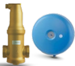
Séparateurs d'air Zeparo & Statico